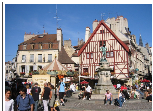
La place François-Rude lui est dédiée par la ville de Dijon .